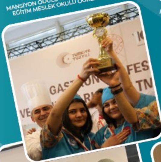
MEB GASTRONOMİ FESTİVALİ VE YEMEK YARIŞMASI MANSİYON ÖDÜLÜ KONYA KARPATAY ÖZEL EĞİTİM MESLEK OKULU ÖĞRENCİLERİ