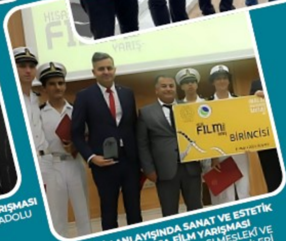
AHİLİK ANLAYIŞINDA SANAT VE ESTETİK KONUSU KISA FİLM YARIŞMASI 1.SI MERSİN TİCARET ODASI MESLEKİ VE TEKNİK ANADOLU LİSESİ ÖĞRENCİLERİ