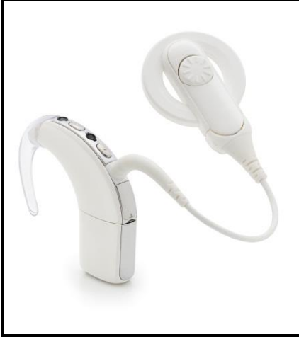
Şekil 2. Koklear implant

Koklear implantın temel prensiplerinden biri, konuşma algısı ve üretiminin gelişmesini sağlamaktır. İkinci hedefi ise akademik ve sosyal başarıyı desteklemektir.