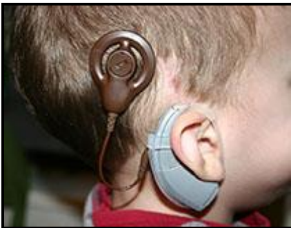
Şekil 3. Koklear implant

Koklear implant uygulamasında implantasyon sonuçlarına etki eden en önemli faktör, uygulamanın yapıldığı yaştır. 12-24 ay aralığında her iki kulakta (bilateral) ileri ve çok ileri derecede işitme kaybı olan çocuklarda, koklear implantın büyük bir faydası olduğu bilinmektedir.